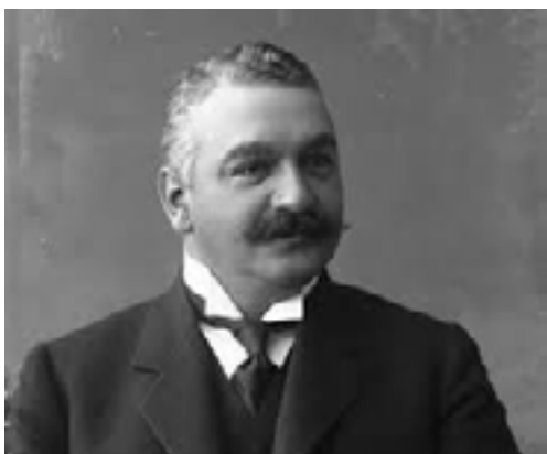
Portrett Sam Eyde

Sam Eydes bil utenfor Admini, Notodden. Eyde står bak bilen.